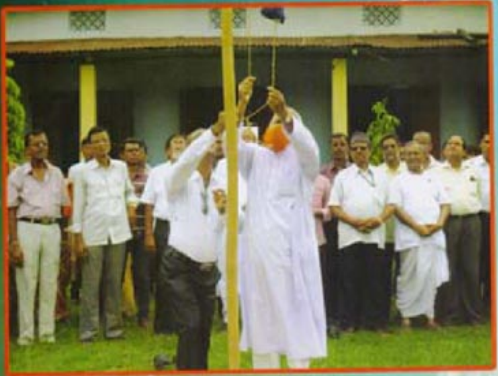
২৫ তম প্রতিষ্ঠা দিবসের পতাকা উত্তোলন