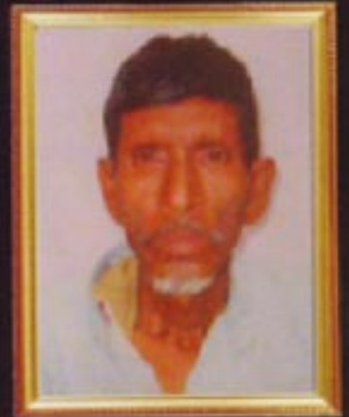
প্রয়াত অনাথ অধিকারী প্রাক্তন সদস্য প্রগতি মহাবিদ্যালয়, আগমণী ।