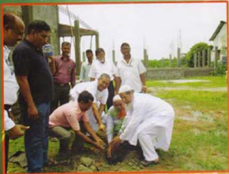
২৫ তম প্রতিষ্ঠা দিবস উপলক্ষে বৃক্ষ রোপন